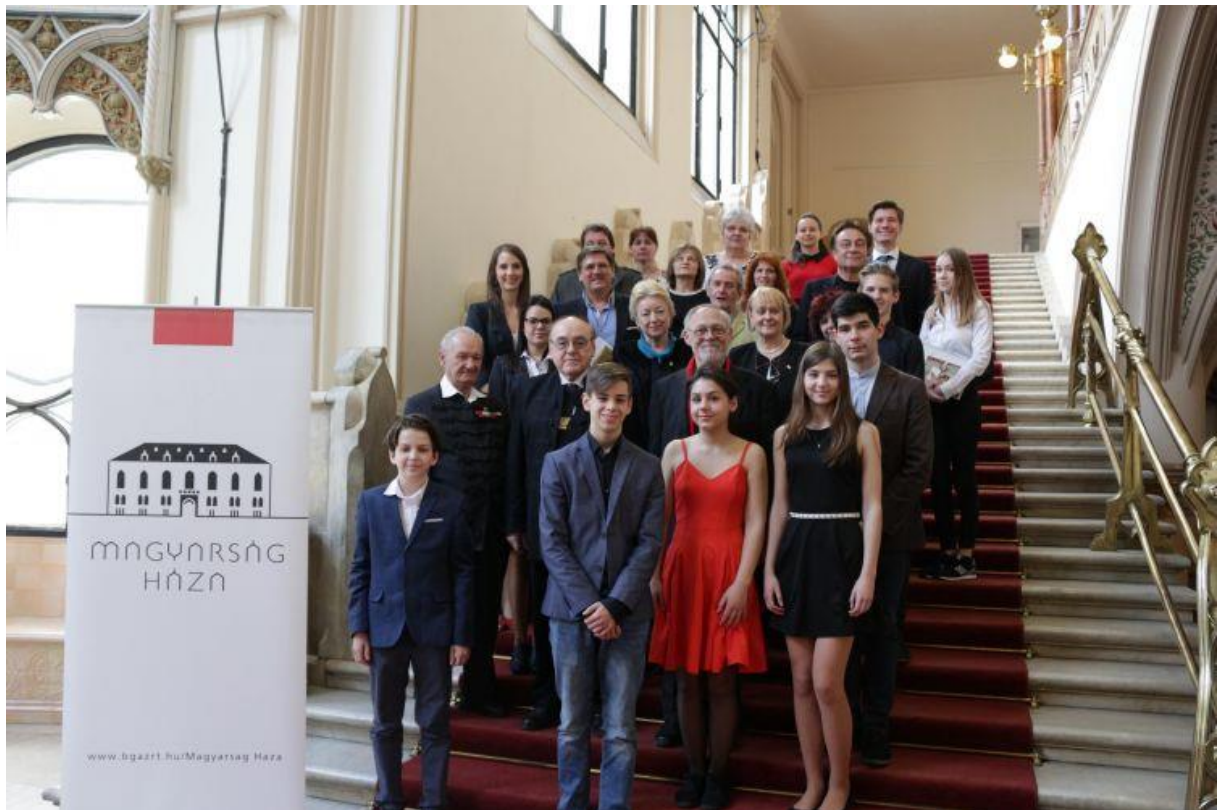
A nyertesek és zsűritagok

– Versenyünk minden évben új arcát mutatja be a magyar költészet kimeríthetetlen tárházának: a hazaszeretetnek, a hazafiasságnak – mondta az intézményvezető. – Szeretném, ha ma úgy távoznátok innen, hogy gazdagodtatok valamivel, ami csak a tietek. Útravalóul Kányádi Sándor szavait választottam: „Szaporodjon ez az ország Emberségbe’, hitbe’, kedvbe”.