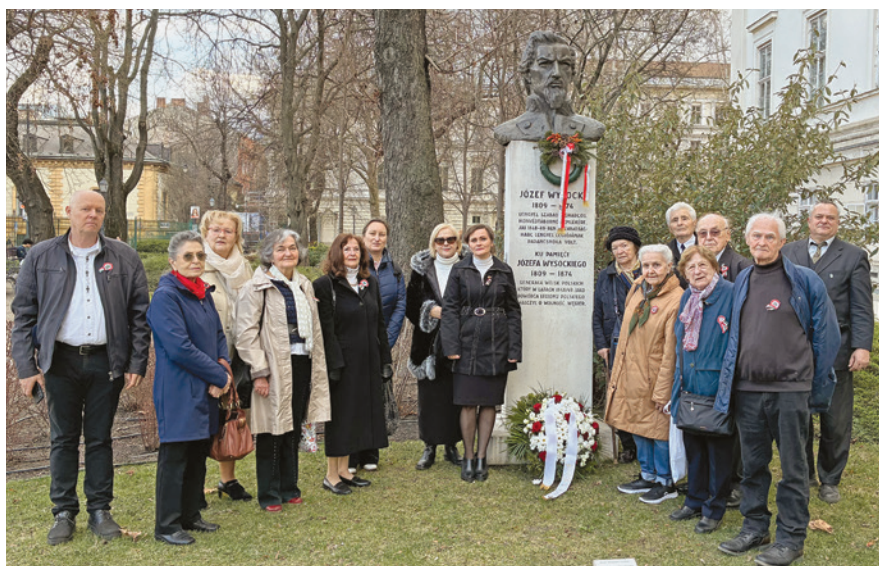
Megemlékezők Józef Wysocki mellszobra előtt

Közismert a lengyel tábornokok és légiósok az 1848-49-es magyar szabadságharcban vállalt szerepe. Legendássá vált Józef Bem tábornok, aki Bem apóként vonult be a magyar történelembe és a lengyel-magyar barátság egyik szimbólumának tekinthető.