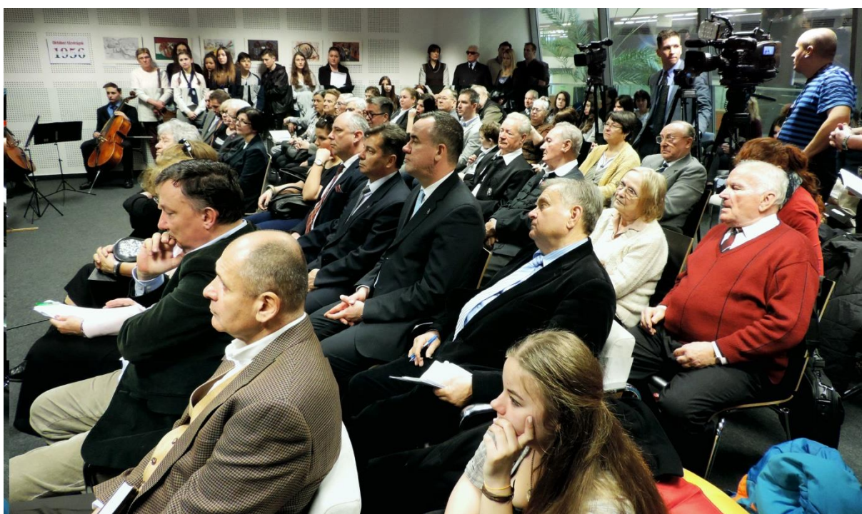
Az antológia illusztrálásához meghirdetett országos rajzpályázat díjkiosztó ünnepsége

Újra és újra idézzük, magunknak is, ezt a gondolatot a Világszövetség Alapító Okiratából, mert a magyar forradalom és szabadságharc csak akkor nem lesz „papírizú” történelmi tananyag, ha mindig lesznek, akik ébren tartják az emlékezés lángját. A Világszövetség már 2014-ben tudatosan készült a 60. évfordulóra. Az esztendő végén megjelentette az Októberi Tűzvirág '56 című antológiát, melybe magyar és külföldi költők verseiből, írásaiból közölt válogatást.