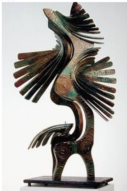
Álommadár (fémesen csillogó faszobor)