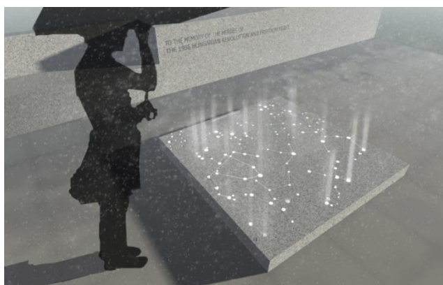
A remény csillagai emlékműterve

Megszólítják a legifjabb kinti generációt is: vegyenek részt azon a rajzversenyen, amelyikre '56-os témájú művel lehet benevezni.