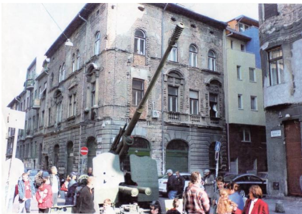
Ma is láthatóak a belövések a Kisfaludy utca 26-os számú házon

A november 4-ei szovjet támadáskor, a körkörös védelemben, a Práter utcai oldalon tartózkodott. Az Üllői út és a Kisfaludy utca sarkához beállt egy orosz harcokcsi, mely tűz alatt tartotta a Kisfaludy utcát. Ebben a harcban 14 magyar halott és 6 sebesült volt.